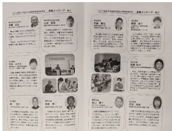
策定委員会の様子