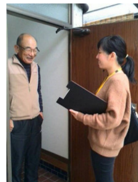
連絡員が被災者宅を訪問