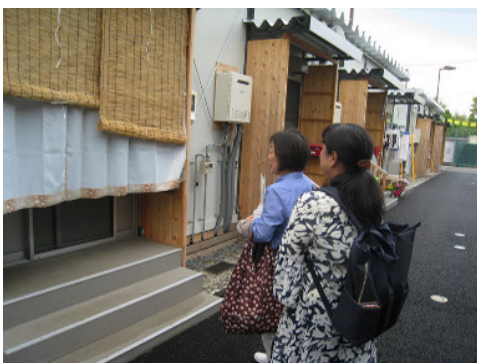
連絡員による建設型仮設住宅への訪問活動

仮設住宅の入居者等に対する見守りや日常生活、生活再建に関する相談支援、住民同士の交流の機会の提供を行います。