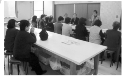
地区社協での 『ふれあいいきいきサロン連絡会』の様子