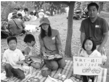
昨年度の「障がい児を囲む親子ふれあい 事業」の様子