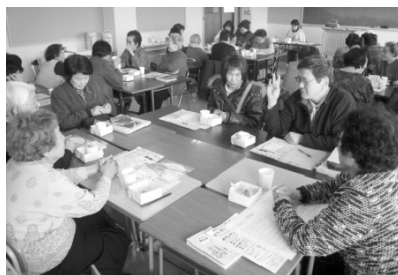
介護者の会でのようす

もっと知って頂けるよう事業活動のPRに努めます。 車いすや介護ベッドの貸出しています