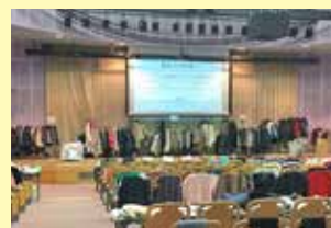
名刺を手作りして自己紹介 ホールいっぱいに支援物資が届きました