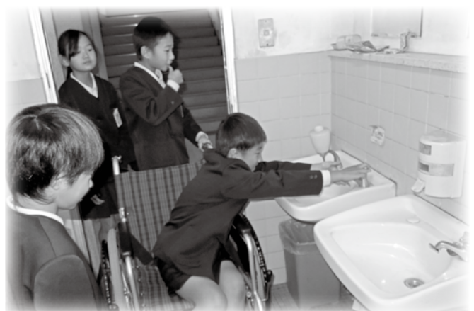
「車イスでトイレに入ってみるとどう感じるかな…」

倉敷市社協では、福祉やボランティア活動への関心や理解を高めただけできるよう、児童・生徒の皆さんや地域の方を対象とした、出前福祉講座を行っています。講師は、日頃地域で活躍されているボランティアの皆様、社協職員などが出向きます。