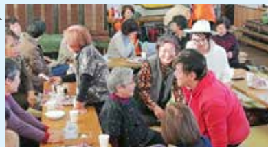
再会を喜ぶ風景がいたるところで見られました

みんなが顔をあわせて「 ホッ 」とできる居場所を復活させたい…。下有井公民館に懐かしい顔ぶれが帰ってきました。