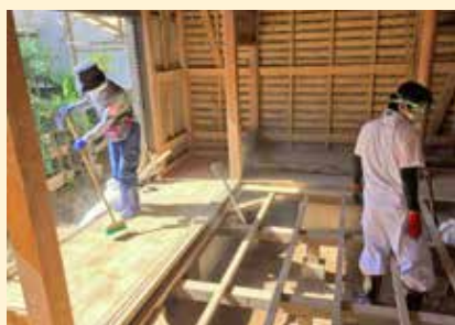
床板はがし、清掃等の活動