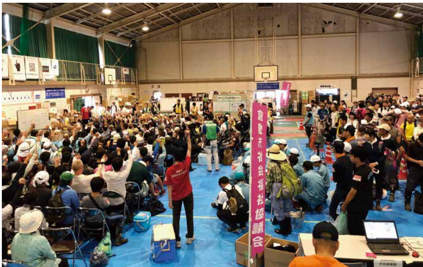
▲「まび、オー!」、災害ボランティアセンターで全国から集まってくださったボランティアの皆様の受付、オリエンテーションの様子