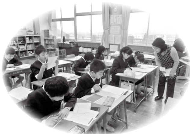
点字体験では、点字で自分の名刺を作ります

※配分申請書の提出は、倉敷市共同募金委員会各支部、分会(倉敷市社協各事務所)で。