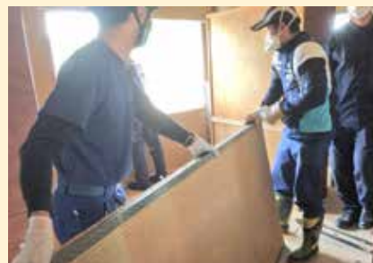
濡れて重くなった畳の運び出し

真備地区では、小田川及び支流の末政川、高馬川、真谷川が決壊し、地区の約4分の1にあたる1,200ヘクタールが浸水。全壊した家屋の被害は約4,600戸に上りました。