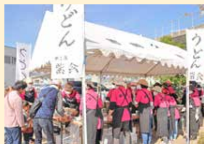
炊き出しのうどん