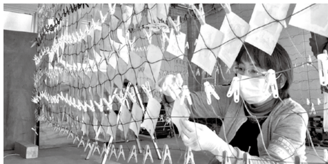
「思い出をつなぐ」写真洗浄ボランティア