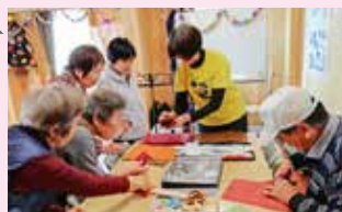
自分だけの革のコインケースをみんなで作りました

柳井原仮設住宅では集会所を拠点にして、おしゃべりやイベント等で交流の場づくりをすすめています。