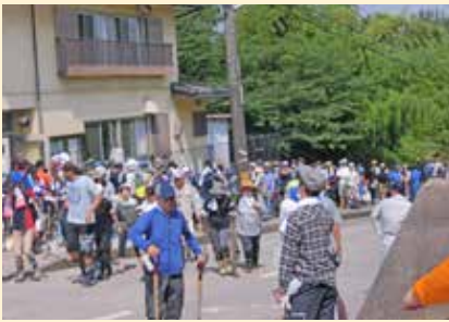
受付と活動出発の様子

水島地区では、コスモタウン広江団地(235軒)の裏山の一部分が崩れ、大量の土砂が住宅街に流れ込む土砂災害が発生。住宅や道路に面した車庫や庭98か所に土砂が流入し、その内、全壊2世帯、大規模半壊1世帯、半壊3世帯、一部損壊4世帯という被害が発生しました。