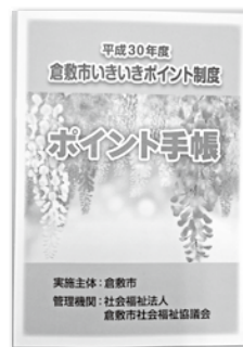
平成30年度用の手帳