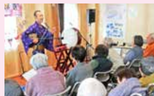
クリスマスコンサートは地元柳井原の住民をご招待