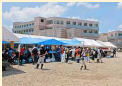
「サテライトその・かわべ」