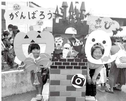
「がんばろう！まび」岡田秋祭りの様子