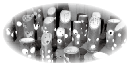
竹の灯ろうに、想いをこめて…