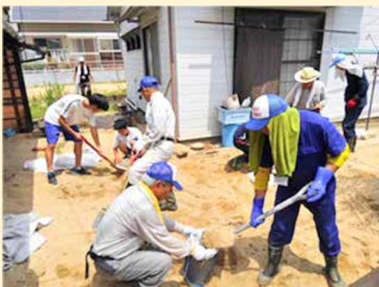
力を合わせて土砂を詰めるボランティア

猛暑の中での活動でしたが、大勢の方のご協力により円滑に作業が進み、依頼された被災者の方に大変喜んでいただきました。