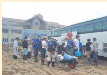
「サテライトやた」に到着したバス