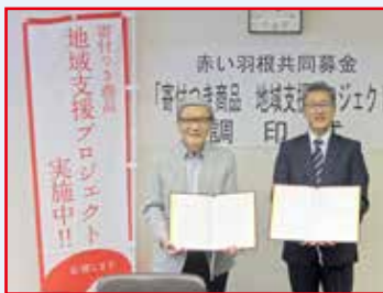
調印式平成 30 年 7 月