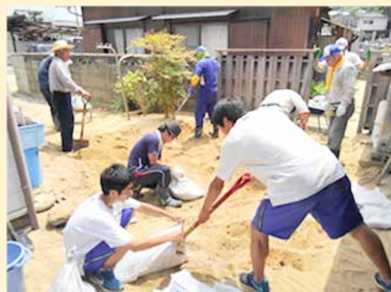
倉敷鷺羽高校の生徒さんたち