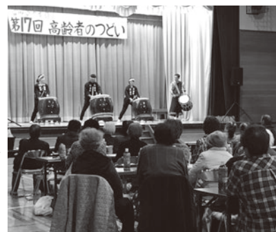
高齢者のつどいの様子(12月)