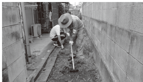
中島地区お助け隊、ただ今活動中！！

『お助け隊』設立のきっかけは、中島地区小地域ケア会議の中で住民同士の助け合い活動をしようと、何度も協議を重ねた結果、倉敷西高齢者支援センター等の協力を得て、令和元年7月にスタートしました。中島小学校区に在住で70歳以上の一人暮らしの方、高齢者のみの世帯の方の“ちょっとした困りごと”（ゴミ出し、草取り等）を、同小学校区在住のお助け隊に登録した隊員さんが“お互いさまの気持ち”でお手伝いする仕組みです。