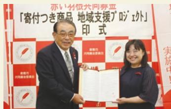
(調印式 令和元年9月)

登録商品名：『岡山スタイルShop晴実堂(harumidou)赤い羽根地域応援プロジェクト』