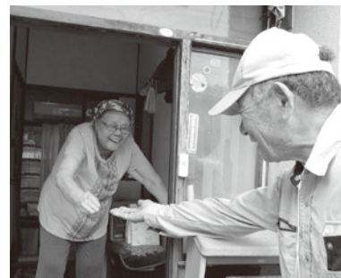
「心強い『お助け隊さん』、ありがとう」