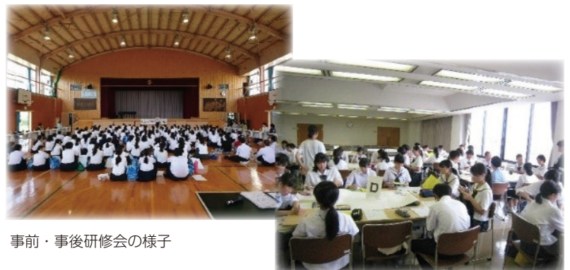
事前・事後研修会の様子