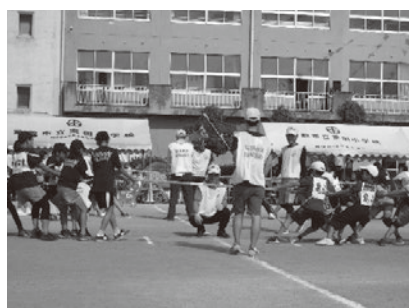
富田地区社協体育祭の様子(10月)

富田地区は、玉島の北西部にあり浅口市と矢掛町に隣接した地域です。昔から特産品の桃やぶどうの生産が盛んで、県下一の産地となっています。地区社協主催の夏祭りや体育祭は、地域の一大イベントとして定着し、子どもからお年寄りまで、たくさんの住民が参加し、盛大に開催されます。地元を離れていても、行事に合わせて帰省する人も多いそうです。昨年度より「防災訓練」や「とんど焼き」も新たな行事に加わりました。このような行事を行うことで、ご近所同士顔を合わせる機会が増え、今以上に結束を強め、住み良い地域になっていけばと思います。