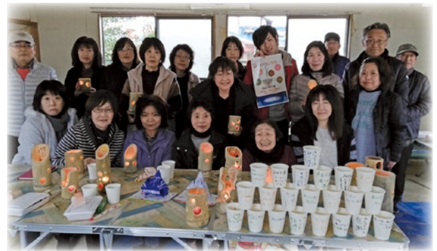
「私も行くから、あんたも行こうや」そんな、やさしい手招きに誘われてたくさんの人が再会を果たしました。

今では、発災前のサロンの参加者以上の住民がこの同窓会に参加されています。再会の場で、参加者から打ち鳴らされる喜びの「拍手」は、一人ひとりのこれからの暮らしを勇気づけてくれています。