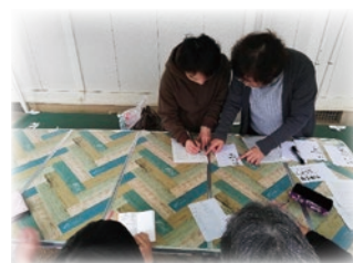
次の同窓会の連絡を取り合うため、みんなで作成しました。