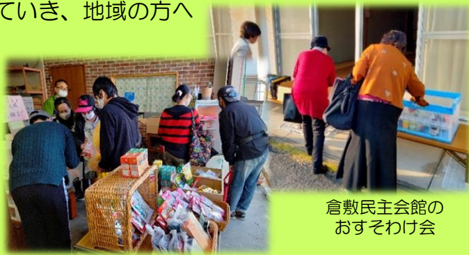
まこと舎のフードシェア会

また、倉敷民主会館の「おすそわけ会」は毎月第4水曜日の15時から開催しているので、必要としている方がおられましたらご活用ください。