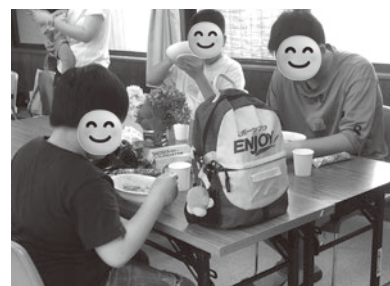
おいしくカレーを食べるこどもたち