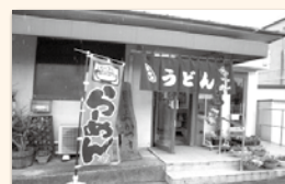
のぼり旗が印象的なお店