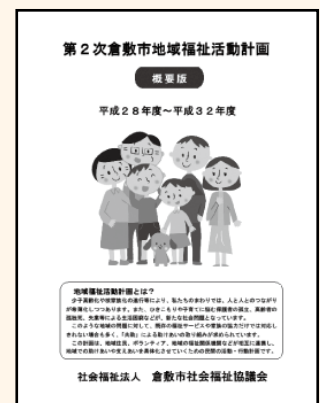
※計画書はホームページで見ることができます

今後も引き続き、計画の内容について広報を行うとともに、平成28年4月からは、具体的な実施事業に取り組んでいきます。