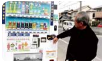
早速、購入者が…。あたたかい お気持ちありがとうございます。