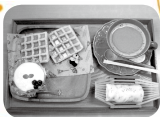
三色すみれが添えられたモーニング