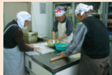
男性料理教室（手打ちうどん作り） 早く自前のうどんを食べてみたいと粉を練る腕に力が入ります。