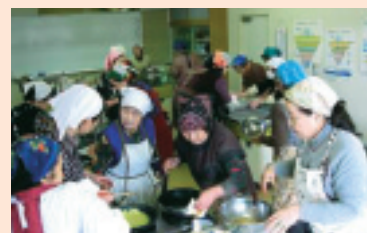
友愛訪問のお寿司作り お年寄りの笑顔を思い出しながら真心を込めてつくりました。