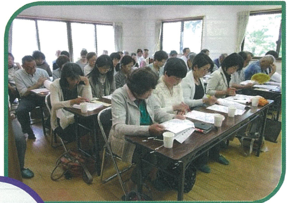
49名の参加者がありました。