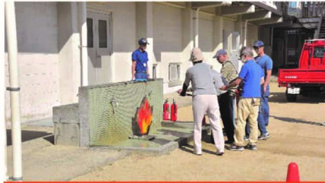
水消火器を使用した消火訓練