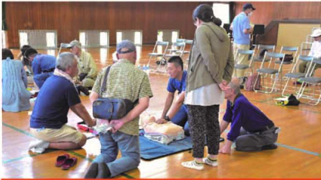
心肺蘇生・AEDの取り扱い