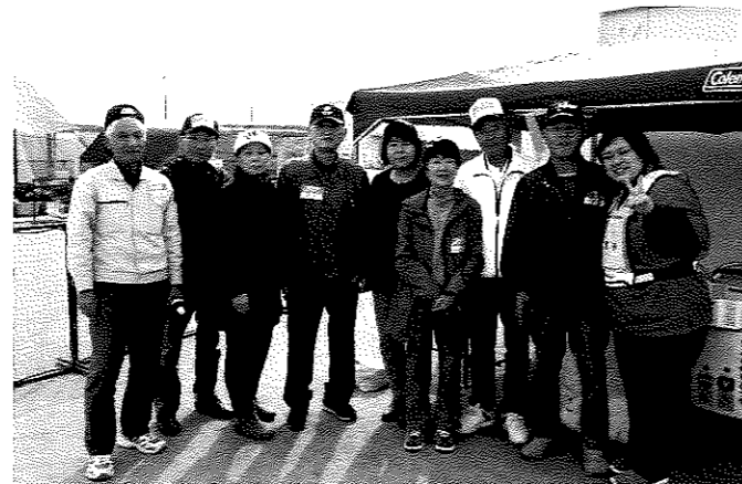
ボランティア活動を長期間にわたりご苦労様でした。