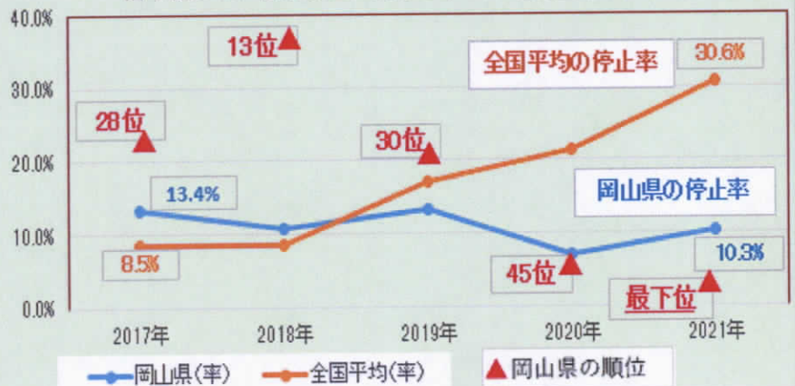
信号機のない横断歩道における車の一時停止率(JAF調査)

信号機のない横断歩道を歩行者が渡ろうとしている場合、車に停止義務があることをご存じですか？上のグラフはその停止率と、全都道府県のなかの岡山県の停止率が何番目なのか、その推移を示したものです。全国平均の数値が飛躍的に向上する中で岡山県が伸び悩み、順位も2021年はついに最下位となっていました。