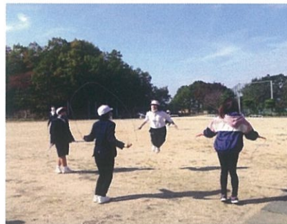
なわとびタイムの様子