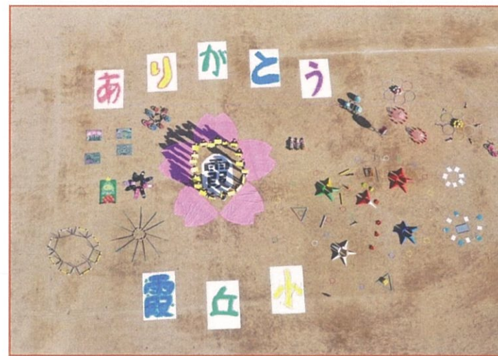
子どもたちからの感謝のメッセージ (運動場上空からドローンにて撮影)

プロジェクトに主体的に取り組んだことで、学校生活がより豊かになるとともに、子どもたち自身も大きく成長いたしました。 すばらしい子どもたちを心から拍手を送りたいと思います。