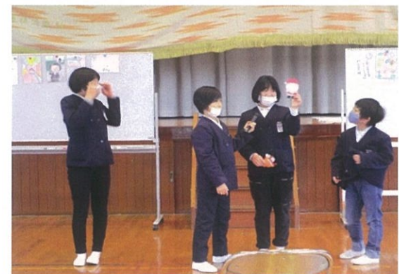
にこにこ集会の様子

プロジェクトに主体的に取り組んだことで、学校生活がより豊かになるとともに、子どもたち自身も大きく成長いたしました。 すばらしい子どもたちを心から拍手を送りたいと思います。