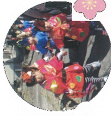
2人1組で手をつないで

沿道には我が子を見守る保護者の方、地域の高齢者の方。かわい い姿に声援を送り、ほっこりとしたひと時を過ごしました