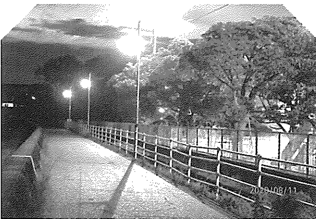
( 防犯灯設置後 )