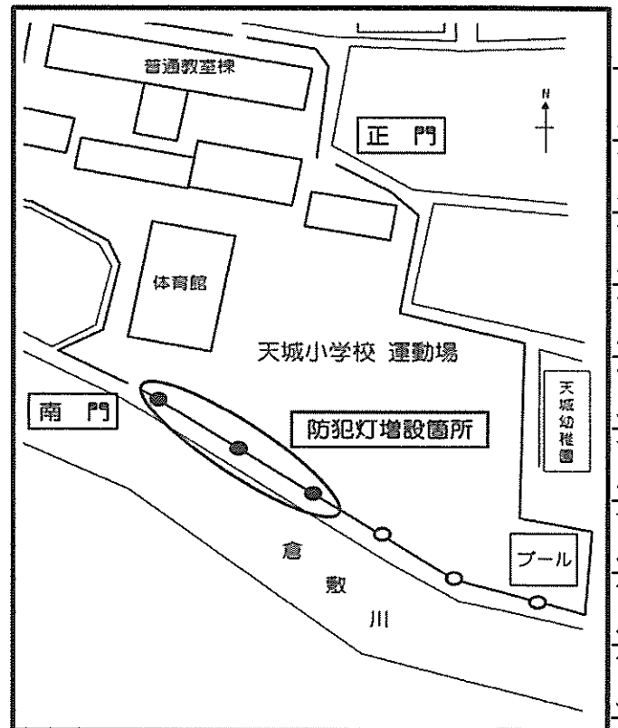
( 天城小学校配置図 )