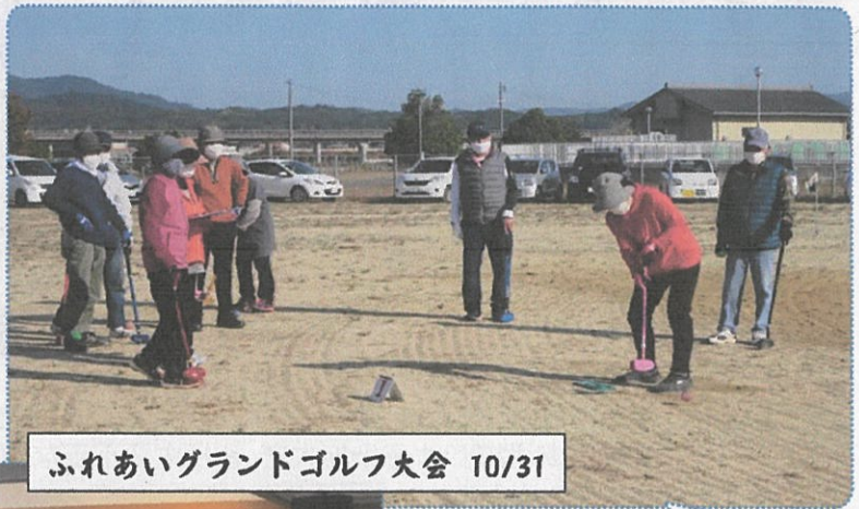
ふれあいグランドゴルフ大会 10/31