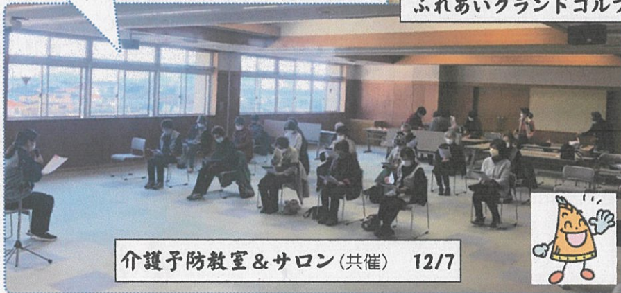
介護予防教室&サロン(共催) 12/7

雲一つない秋晴れの中で、気持ちの 良い汗をかきました。子どもの 参加もあり、和やかな会になりま した。