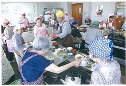
6/8 高齢者料理3 ▲