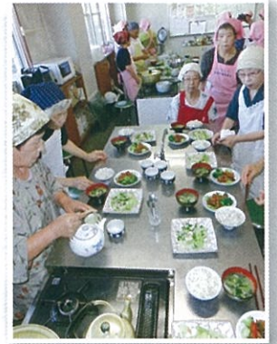
9/14 高齢者料理16 ▶

【内容】1.もち麦ご飯 2.ロール牛肉の煮込み 3.シーフードサラダ 4.しめじと小松菜のみそ汁 5.新緑の抹茶プリン 【感想】肉巻にピクルス、パプリカは初めてだったが、おいしかった。いつも妻任せの為、久しぶりに包丁を使って、おいしい料理が出来た。グループの皆さんと楽しく短時間で料理でき又 大変おいしかった。