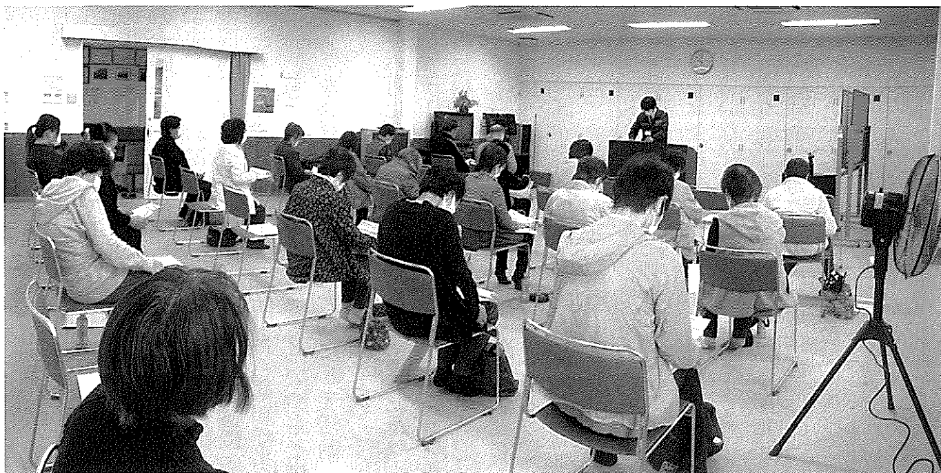
高梁川・小田川河川流域の防災・治水対策工事について（勉強会）

小田川の改修の進捗状況と今後、地域住民の生活にどのような変化を及ぼすか、国土交通省（中国地方整備局）の方から、説明を受けました。