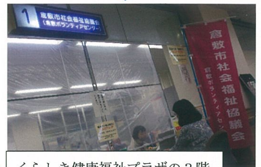
くらしき健康福祉プラザの3階

民生委員が、集まった会費を倉 敷市社会福祉協議会へ納めに行 きます。領収書の発行を待つて いるところです。