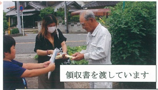
領収書を渡しています

町内の役員さんが普通会費 (300円)を集めに行きます。 町内で一括して納めている所も あります。