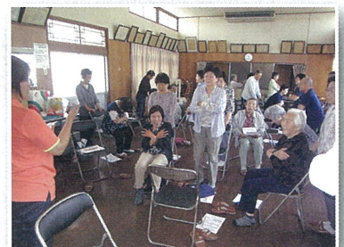
①水江サロン・体力測定

【サロン活動】 ふれあいいきいきサロン(以下サロン)とは、地域で高齢者や障がいの方が生きがい活動と元気に暮らすきっかけづくりを見つけ、地域人同士のつながりを深める自主活動の場です。また、地域で交流の場をもうけることで住民への関心を深め、近隣での助けあいを育む地域づくりを目指しております。中洲学区内で「サロン活動」は、現在9町内で、月に1~4回開催されております。