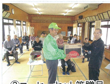
④活動に必要器具贈呈