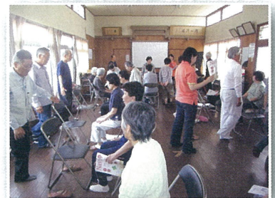
②コーヒー、コップ等贈呈

【内容】 毎月第2金曜日、10:00~12:00に百歳体操(40分)の後、水分補給をして、6月と12月に体力測定(①片足測定、②30秒椅子立ち上がり測定、③5m走行測定)を実施しています。