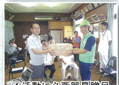
④活動に必要器具贈呈