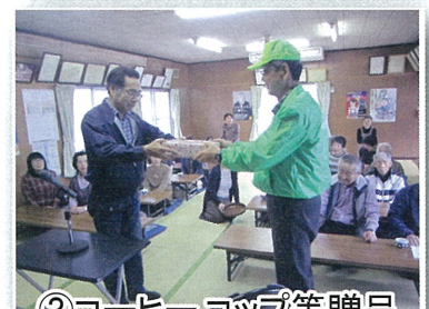
③コーヒーセット等贈呈

【内容】 H29年度4月から第1・第2・第3木曜日に町内公民館を会場として、百歳体操とおしゃべりを楽しみ、喫茶も出来るサロンが開催されている。中洲地区社協からサロンへコーヒー・コップなどを贈呈してもらい、いつまでも「地域の集いの場」として継続されるよう贈呈式を行った。