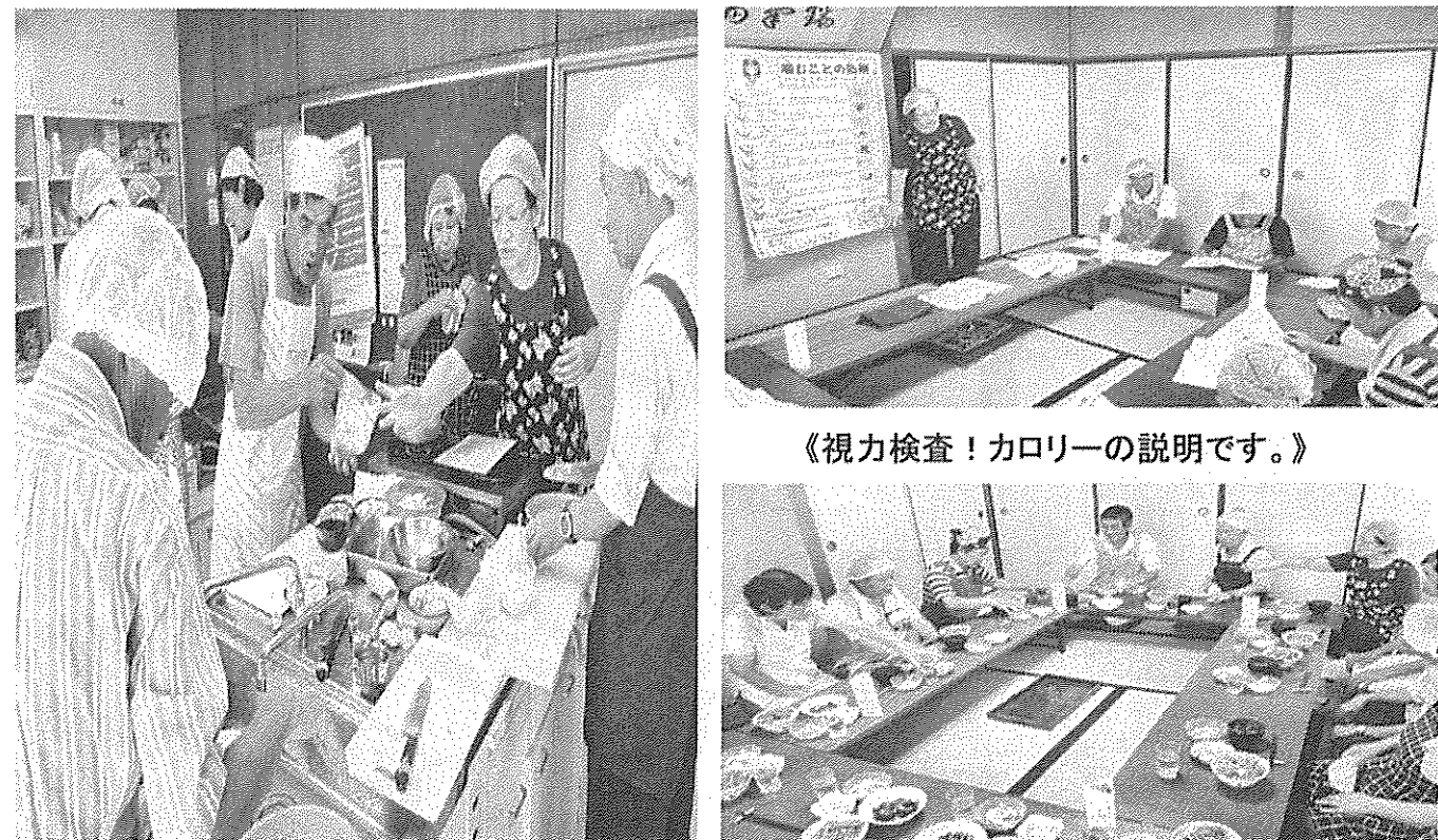
《あ!それ、ちょっとそうじゃなく...》

10時より、日常食べている食材で男性陣は、女性陣に手取り!包丁取り!の奮闘で、ヘルシーで低カロリーのご馳走が出来上がりました。