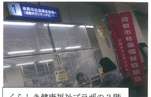
くらしき健康福祉プラザの3階

民生委員が、集まった会費を倉 敷市社会福祉協議会へ納めに行 きます。領収書の発行を待って いるところです。