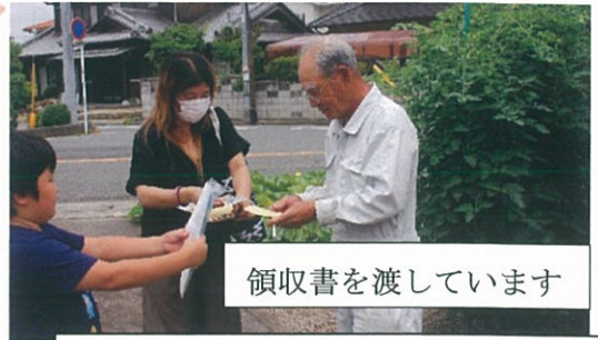
領収書を渡しています

町内の役員さんが普通会費 (300円)を集めに行きます。 町内で一括して納めている所も あります。