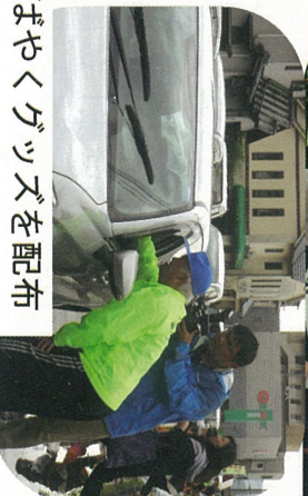
赤信号で停車中にすばやくグッズを配布