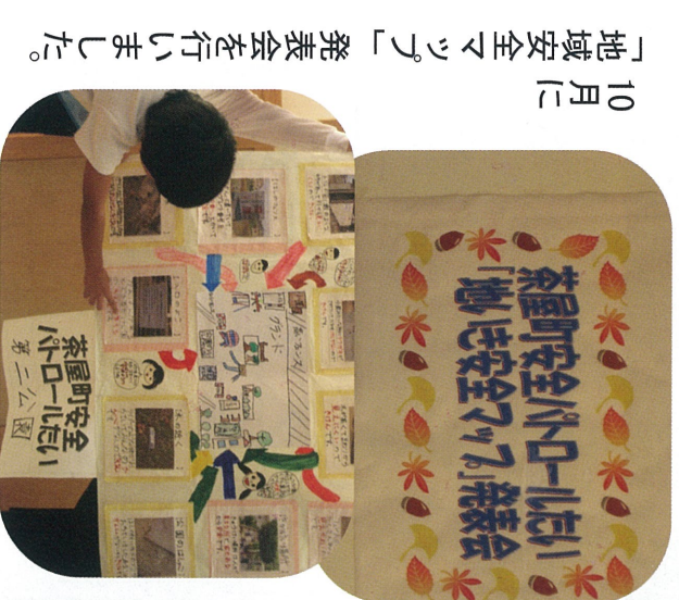
10月に「地域安全マップ」発表会を行いました。