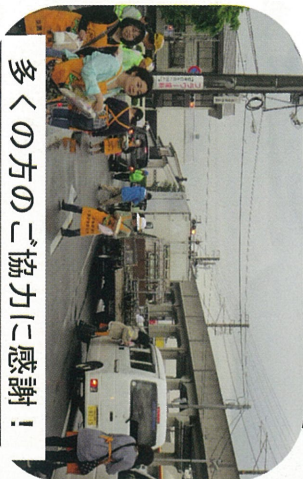
多くの方のご協力に感謝！