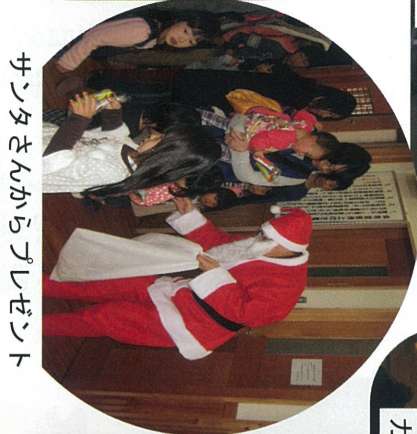
サンタさんからプレゼント