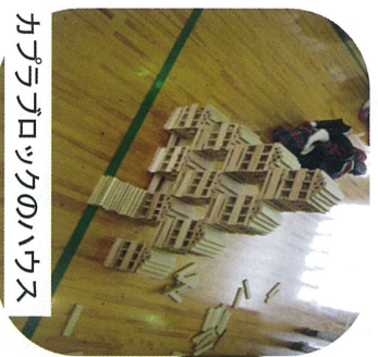
カラオケのハウス