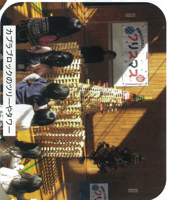
カラオケのツリーやタワー