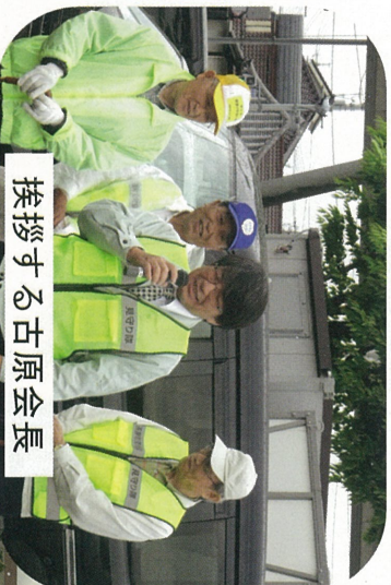
挨拶する古原会長