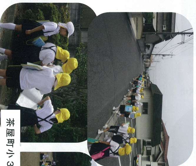
茶屋町小3年の児童