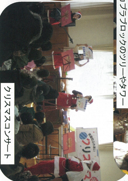
クリスマスコンサート