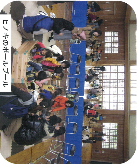
ヒノキのボールゲーム