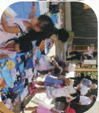
フリーマーケット