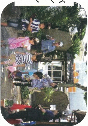
バルーン プレゼント