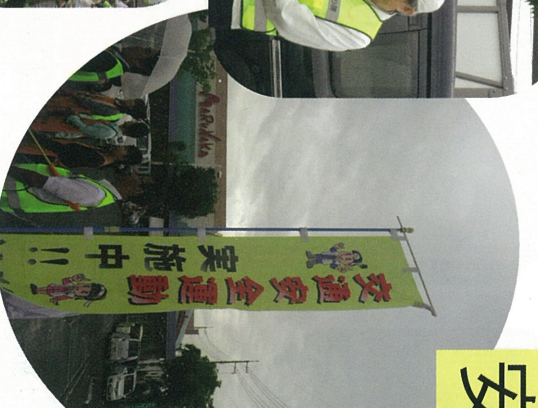
交通安全運動 実施中