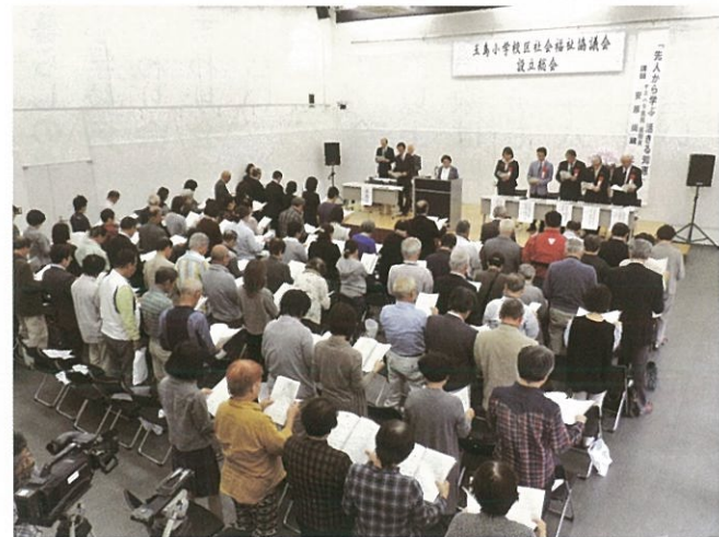
平成28年10月23日(日)(たまテレホール)