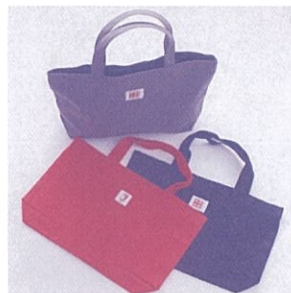
A4サイズの資料が入る横型トートバッグ オリーブ色・赤色・紺色 高さ23cm 横38cm マチ約8cm