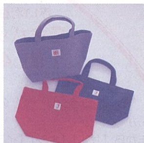
お弁当入れ オリーブ色・赤色・紺色 高さ24cm 横38cm マチ約14cm