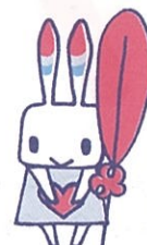
倉敷市共同募金委員会の オリジナルマスコット キャラクター「うさビー」 です。