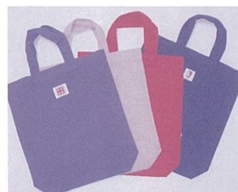
A4サイズの資料が入る縦型トートバッグ オリーブ色・からし色・赤色・紺色 高さ33cm 横30cm マチ約8cm

倉敷市共同募金委員会のマスコットキャラクター「うさビー」と「倉敷帆布」のネームが付いています。