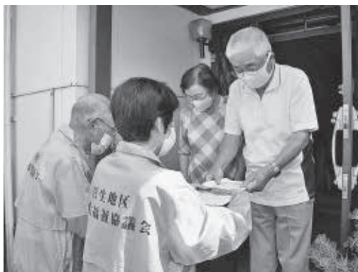
高齢者宅を訪問しマスクをお届けしました

菅生地区社協では、お弁当配布(75歳以上の在宅で独居生活の方)、百歳体操、福祉講演会、防災活動など地域活動を精力的に続けてきました。しかし、新型コロナウイルスの影響で、これまでの地区社協事業にも変化が求められるなか「何もできないのではなく、新しい地域のつながり方、見守り方、参加の仕方があるのではないか」とマスク作り活動を通じて倉敷市社協が実施する地域とつながる『つながり・安心を増すマスクプロジェクト』に参加しています。百歳体操などが始まる前の時間などを活用しコツコツと作られたその数は、何と約850枚。10月から随時、高齢者宅の見守りを兼ねて訪問しお届けしました。受け取られた方からは感謝の言葉のほかに、菅生幼稚園・菅生小学校の子どもたちから添えられたメッセージカードに「心が温まる」と喜ばれていました。マスクの作り手からは「この時期はマスクが一番喜ばれると思う。コロナに感染しないで皆で無事乗り越えていきたい。」と語っていただきました。