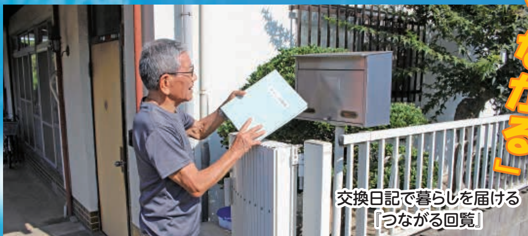
交換日記で暮らしを届ける 「つながる回覧」