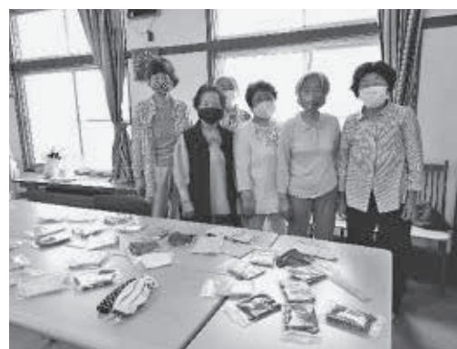
ひと針ごとに思いを込めたマスク作り