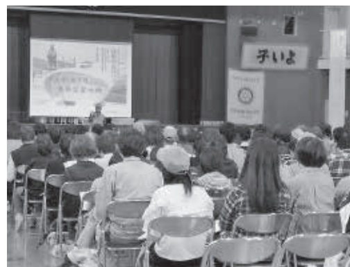
参加者全員が真剣に受講しました

大野会長は、「皆さんからの声を受けて、今後は自力で避難できない方たちの避難支援マップを作成し、見守り活動を強化していきたい。」と語っていただきました。