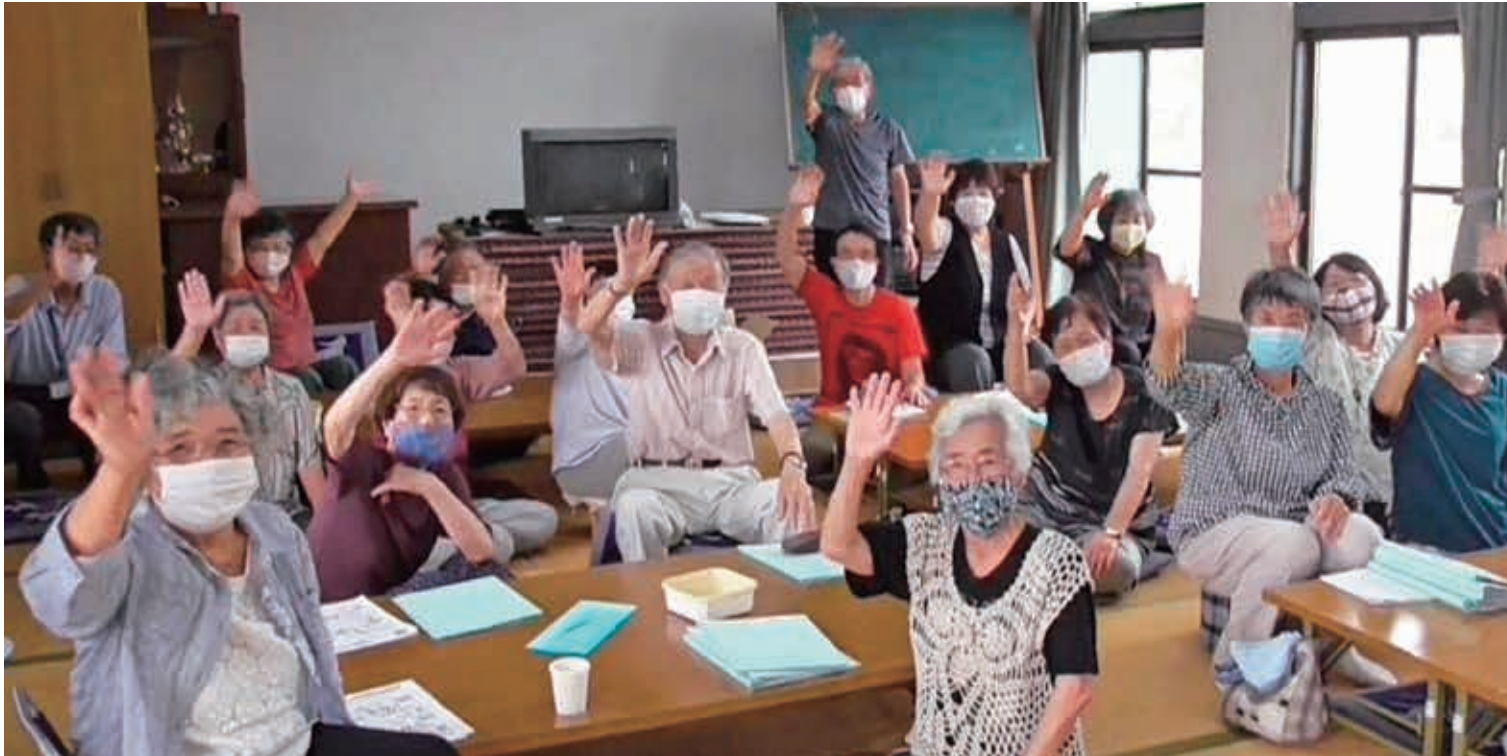
コロナのなかでもつながるココロとココロ（居場所） マスクの上からでも笑顔とやさしさが伝わります。（西酒津：サロンサカツ）

私たちのこれまでの暮らしは、誰かにつながり、誰かとふれあうことで、お互いの暮らしに関心を人との交流が当たり前だった日々に、突如として訪れた、新型コロナウイルス感染症の脅威…。新しい生活様式や、今後への備えが求められるなか、つながりを切らないために、取り組む新し