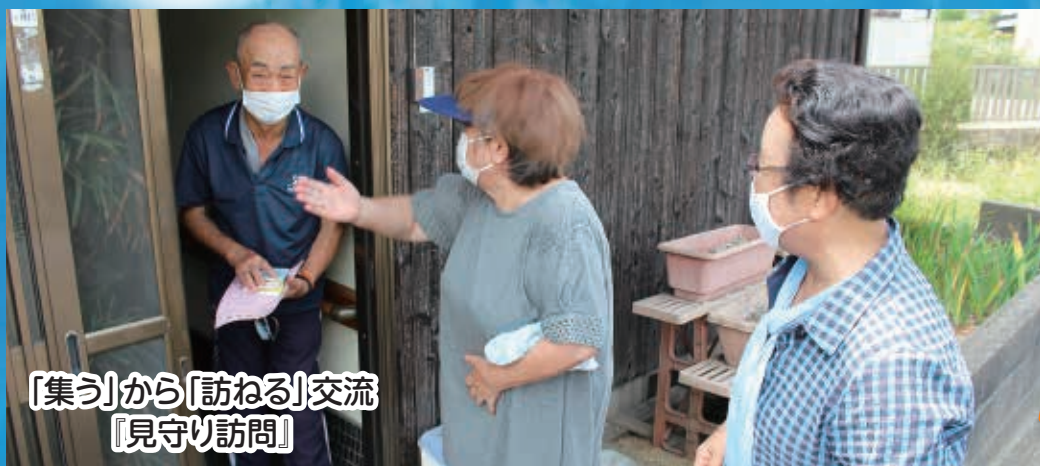
「集う」から「訪ねる」交流 「見守り訪問」