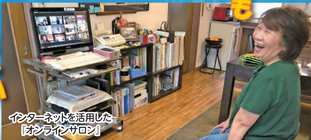
インターネットを活用した 「オンラインサロン」