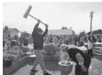
八幡地区社協 令和元年度三世代交流もちつき大会