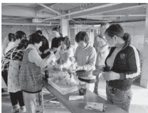
いざという時のために非常食を試食

連島西浦地区社協では、令和元年に「地区防災を考える会」を立ち上げました。この会は、最近頻発する異常気象によって「日本のどこにいても自然災害は発生する」という認識に立ち、地域の安全安心を守るために地域で災害に備えることを目的としています。