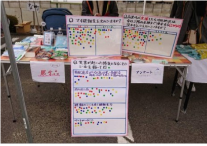
まちづくり主催の「冬まつり」で「川辺復興プロジェクトあるく」が行った防災に関するアンケートの様子。