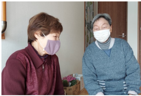
平成26年3月に、地域の住民の方に行った服部地区の 気になることのアンケートの結果から、この見守り・ 支え合い活動は始まりました。

服部地区見守り支え合い活動の五カ条。 小地域ケア会議の開会前に毎回唱和 しています。