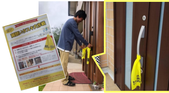
川辺地区の防災訓練で、掲げることで一目で安否が確認できる「黄色いタスキ大作戦」が行われました。川辺地区全世帯の60%以上が参加！関心の高さがうかがえます。