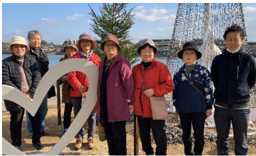
名前もみんなで決めた「いきいき元気柏島」。柏島地区では、通いの場から地域のつながりが続いています。