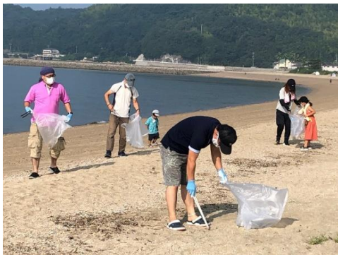
近隣のお店や福祉施設の職員、他の地区からのボランティアも駆けつけてくれました。