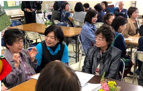
生活の場所がバラバラになった被災者が再開できる場であり、同じ地元でも関わることがなかった被災者がつながる場でもありました。