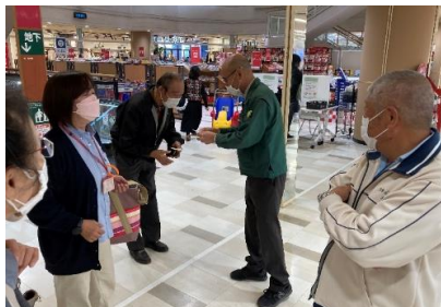
食材の買い物だけでなく、衣料品やATMなどもある大型スーパーなので、生活に必要なものを自分で選ぶことができます。車の乗降場所なども、協力的な店長さんが相談に乗ってくれました。