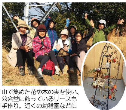
山で集めた花や木の実を使い、公会堂に飾っているリースも手作り。近くの幼稚園などにも贈りました。