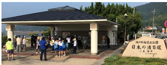
家族での参加も多く、交流と清掃を兼ね合わせた活動となっています。