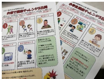
5種類のコースを用意して、自分が取り組みたいものを選ぶ工夫があります。