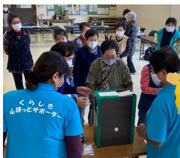
長尾の有志による手作りの小物入れや人形などの作品は、お土産やくじ引きなどにして参加者を元気づけました。