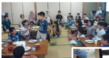
食を通じて世代間交流ができるのも、料理教室の魅力です。