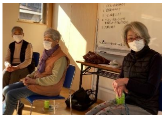
コロナ禍以前は、歌いながら体操を行っていました。歌のリズムに合わせてゆっくりと負荷をかけることで、体操の効果も上がります。