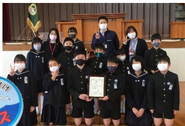
地域に向けてできることを取り組む「地域お助けキッズ」オリジナルバッジが贈呈されました。学校を卒業しても、地域を想う気持ちは続いていきます。