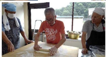
教室で行ったうどん作りのレシピは小地域ケア会議通信を通じて地域にも紹介しています。