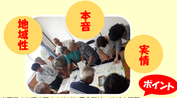
※真備の川辺地区の小地域ケア会議は、地域の課題やできることを腹を割って話し合うことを目的に、「腹を割って話そう会」という名称にしています。

小地域ケア会議とは… 主に小学校区単位で、地域に密着した視点を持ち、課題を把握して、地域の実情に合わせて住民と専門職が誰もが安心して暮らせるまちづくりを目指して話し合う場です。