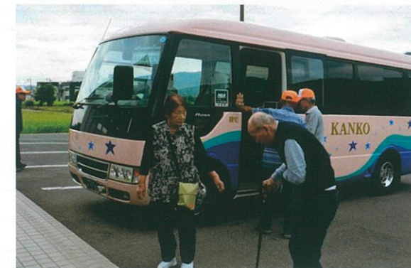
バスによる送迎もありますよ (写真は令和元年度敬老会を添付しています。)

※ 昨年度はコロナで中止致しましたが、 今年度は、ワクチン接種状況により実施予定です。 (写真は令和元年度敬老会を添付しています。)