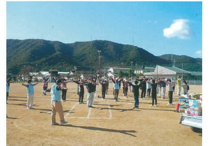
はよう! 打たにやー 後が使えるとるでー 準備体操をしっかりやって足、腰を丈夫にしとかな!