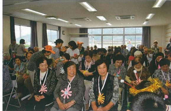
皆さん! 笑顔で元気でいいですね!! (令和元年度敬老会の写真を添付しています。)