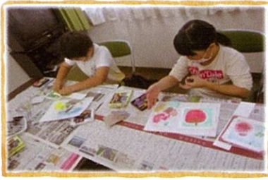
2020年12月23日クリスマスリース