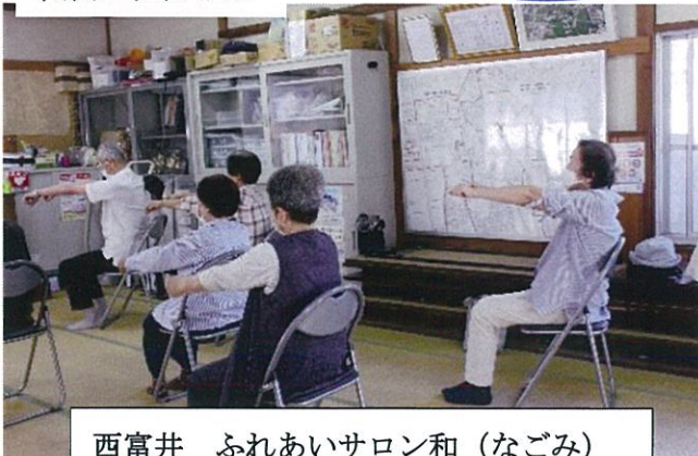
西富井 ふれあいサロン和 (なごみ)