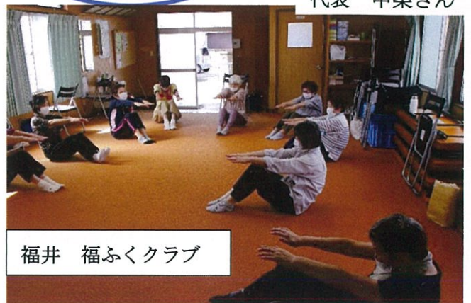
福井 福ふくクラブ