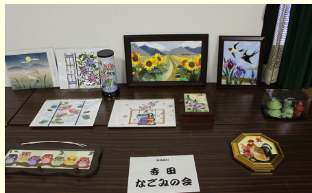
手芸等の作品展示