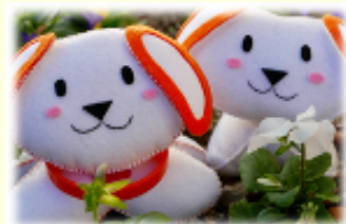
▲オレンジリング犬「笑ちゃん」