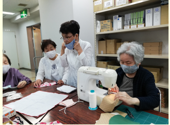
▲マンションでの新しい交流の仕組み「エグゼ友の会」

倉敷市では地域福祉基金を創設し、ボランティア団体が、高齢者、障がい者、子育て中の親子などに対して行う保健福祉に関わる活動を助成しています。