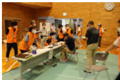
災害ボランティアセンター設置運営訓練の様子