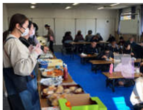
「地域食堂」に幅広い年代層の人たちが集い、交流している様子