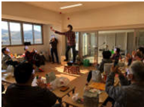
つながりづくりの一環として実施した「おたのしみ会」の一場面

令和5年度は、孤立防止を目的とした個別支援に加え、再建先での生活が安定するように地域とのつながりづくりを意識しながら支援活動を継続していくこと、地域内の各種行事やサロン等への参加を促しながら生活を安定、定着させる活動を行うこと、災害に対する不安を軽減し、平時からのつながりを持つことを目的に個別避難計画、マイ・タイムラインの作成を呼びかけ、その支援を行います。