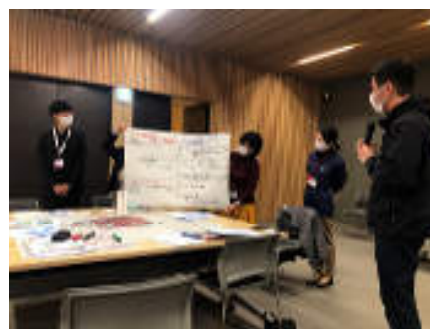
奈良市で開催された合同職員研修の様子