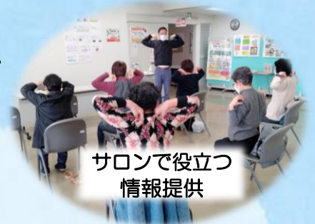
サロンで役立つ 情報提供

12月13日(水)までに社会福祉協議会へ 電話またはFAXでお申し込みください。 (FAXでの申込の場合は裏面を参照して ください)