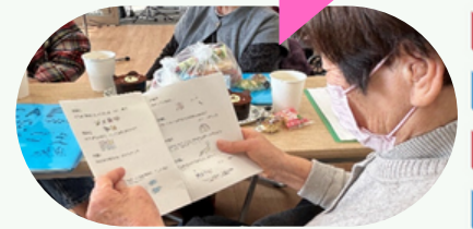
真備のサロンでも楽しまれてました♪