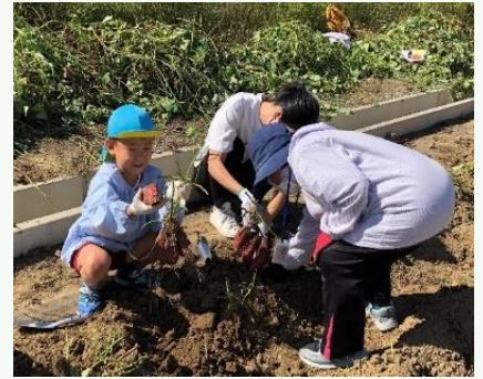
グリーンパークまびでの芋ほり大会の様子