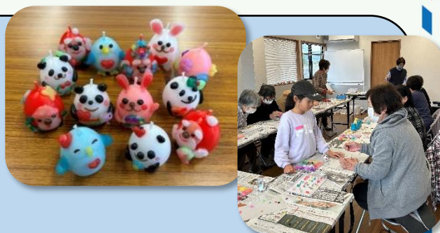
「指の運動にもなったね！」

同じ町内のご近所さんサロンではオリジナルキャンドルづくりを体験。そこには小さい頃からのつながりで、近所の小学生や倉敷まきび支援学校に在学中の生徒も自然と参加しています。「近所のおばちゃん」が手伝ってくれたり、片付けを一緒にしたりと、温かい雰囲気の中で世界に一つだけのキャンドルが出来上がりました。