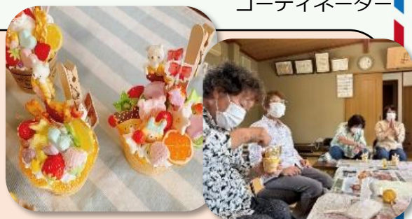
「乙女の気持ちを思い出すわ」

先生の指導のもと、カップケーキの上に先生が作ったフルーツやキャンディなどのミニチュアを好きなようにかわいくデコレーションした「デコスイーツ」を作りました。高齢の参加者も、気分が明るくなり少女のような気分が味わえました。